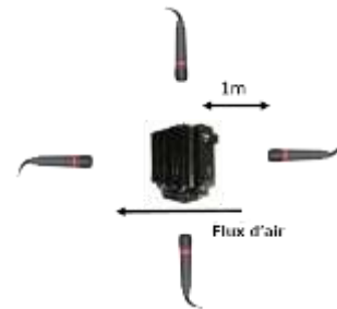
Figure 2 - Tableau des résultats des tests en chambre anéchoïque pour le HEX2.0 avec le ventilateur San Ace 92 de Sanyo Denki, à différentes puissances du ventilateur. La figure de droite montre schématiquement les microphones mis en place autour du HEX 2.0 pour les mesures acoustiques.

Le niveau sonore du HEX 2.0 a été mesuré avec le ventilateur installé dans le radiateur du processeur pour mesurer les performances en situation réelle. Le régime du ventilateur a été contrôlé avec une alimentation PWM. Les résultats typiques pour des niveaux sonores à différents régime du ventilateur sont représentés sur la figure 2. Les données montrent que le ventilateur atteint seulement 33-34 dB-A lorsque le ventilateur fonctionne à plein régime avec une moyenne de seulement 32 dB-A. Ce qui correspond aux valeurs observées pour des ventirads considérés comme silencieux. En outre, il convient de noter que le bruit de fond de la chambre anéchoïque a été mesuré au minimum à 17 dB-A. Ainsi, à un régime ralenti (~ 1000rpm), le bruit du HEX 2.0 est inférieur au bruit de fond dans la chambre, ce qui signifie qu'il est pratiquement silencieux à ces vitesses.